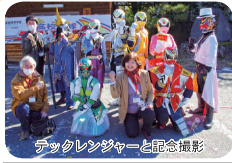
テックレンジャーと記念撮影

今回、松尾少年スポーツクラブの活動紹介にもあった、松尾地区で活動するドッジボールクラブ「飯田DBC REAL」が、「第27回県小学生ドッジボール選手権大会」(知事杯)で、初優勝を果たした。