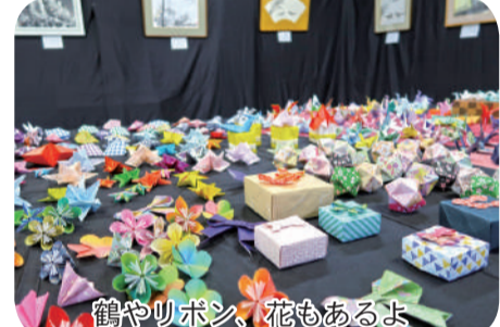
鶴やリボン、花もあるよ