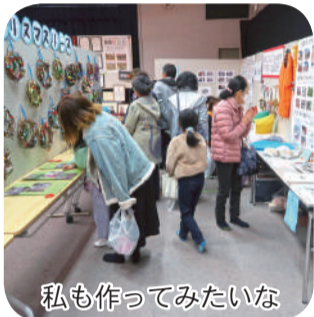
私も作ってみたいな