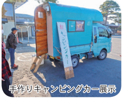
手作りキャンピングカー展示