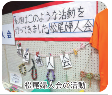
松尾婦人会の活動

2月19日、新井コミュニティ消防センター2階大広間で新井区文化祭が2年振りに開催された。 コロナの影響で活動を休止している団体が多く、展示作品は以前の半分ほどとなったが、写真、書、絵