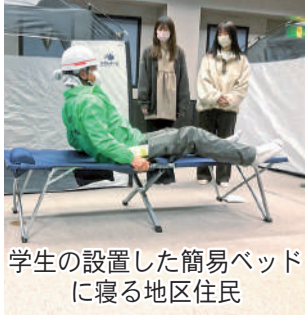
学生の設置した簡易ベッドに寝る地区住民

*防災訓練 3月4日、防災訓練が行われ50人が参加した。飯田女子短大との初の合同訓練となった。