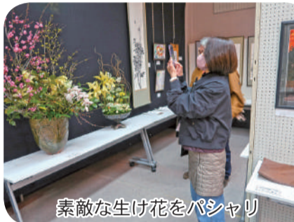
素敵な生け花をバシヤリ