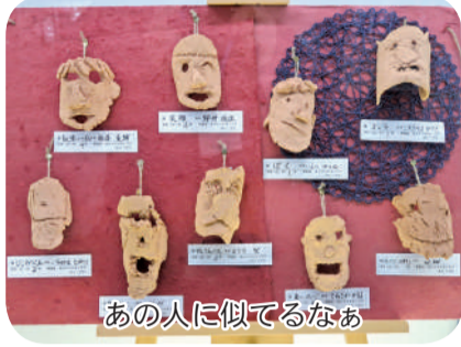
あの人に似てるなあ