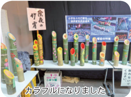
カラフルになりました