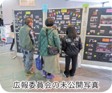
広報委員会の未公開写真