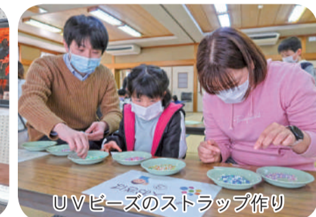
UVビーズのストラップ作り