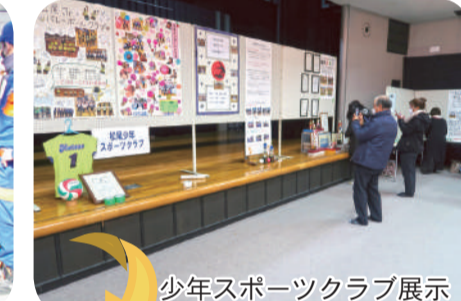
少年スポーツクラブ展示