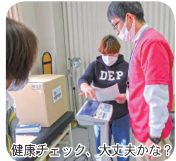
健康チェック、大丈夫かな?