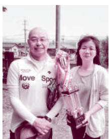
嬉しいトロフィー

【寺所区】5月27日、寺所集会所にて寺所伍組対抗ニュースポーツ大会が晴天の中、開催され40人が参加した。前半と後半で公園と集会所に分かれ、ペタンクと囲碁ボールの両方を楽しんだ。