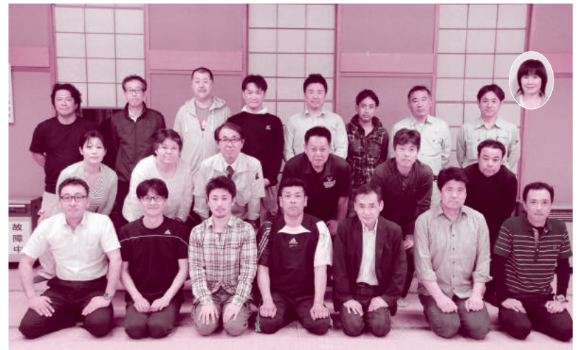
☆各種大会へのご参加をお待ちしています。