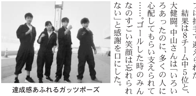
達成感あふれるガッツポーズ