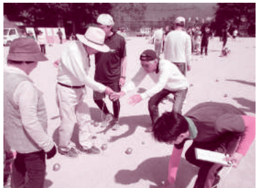
どのチームが近いかな