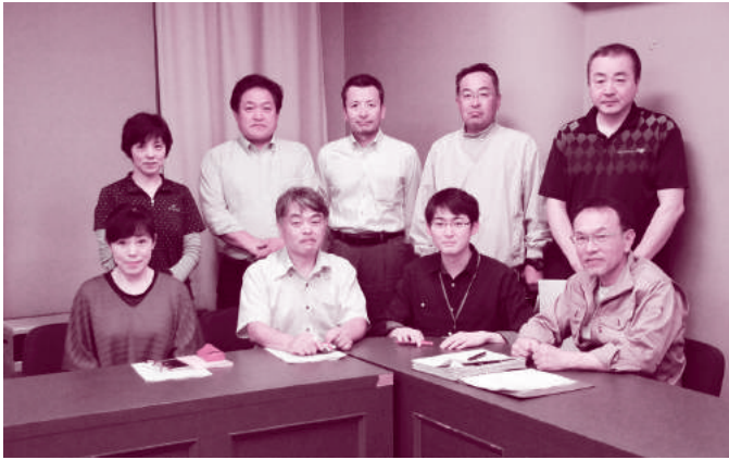
☆松尾地区について学ぶ松尾セミナーにご参加ください