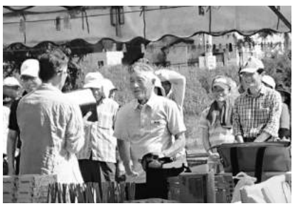
優勝者へは記念品が授与された

4位が決まった。さらに男性の個人戦においても同スコアでトップが2人となったため、年長者が優勝となった。そして今回はホールインワン賞の該当者がなかったため、開催月が6月ということでも「6」のつく順位の人が急遽特別賞が渡されるなど珍しいことが重なる交流大会となった。