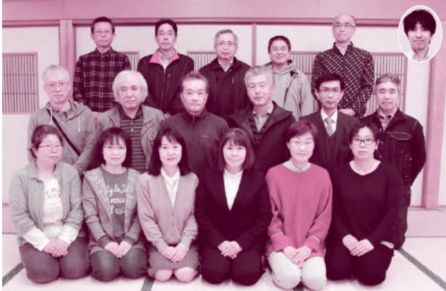
☆地域の情報をお待ちしています。 ☆文化祭広報委員会企画もお楽しみに！